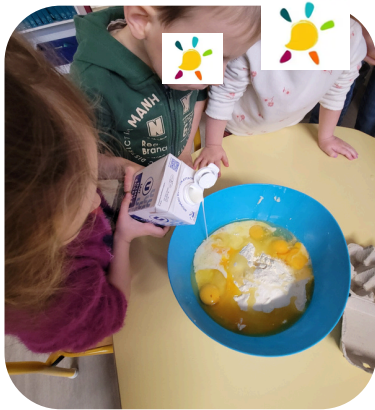
Préparation de la pâte à crêpe par les PS-MS

Course pour les plus grands, courir pour ceux qui ne peuvent pas le faire.